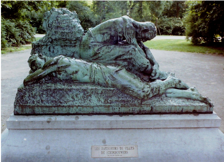
Charles Van der Stappen, Les bâtisseurs de villes (parc du Cinquantaire).

Je passe sur des arguments tels que (p.46) chaque réparation s'accompagnant d'une fermeture partielle à la circulation. Vu le charroi actuel et futur attendu sur l'avenue, ces réparations seraient fréquentes. Dans le passé l'avenue du Port écoulait bien plus de trafic lourd qu'actuellement : la gare maritime de Tour et Taxis traitait 30 trains complets de marchandises par jour (mais j'ai déjà développé ça l'an dernier).