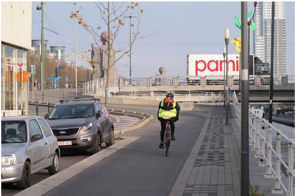
ICR "CK" en amont de l'avenue du Port : Quai des Charbonnages, vue en direction de Vilvorde du trottoir cyclable actuel (2,20 + 0,50 m).