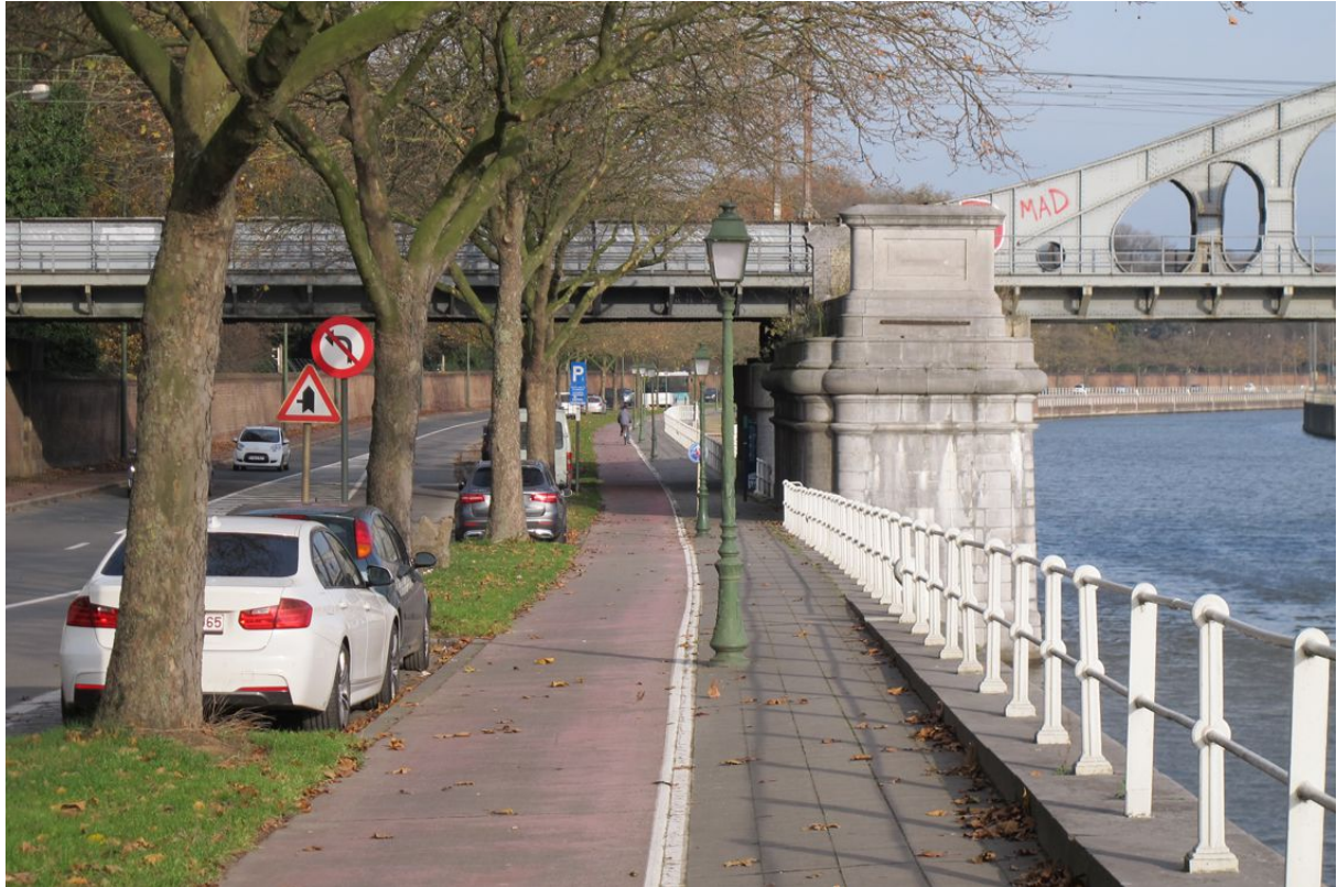
ICR "CK" en aval de l'avenue du Port : Chaussée de Vilvorde, vue en direction de Vilvorde de la piste cyclable actuelle (1,75 m de large).