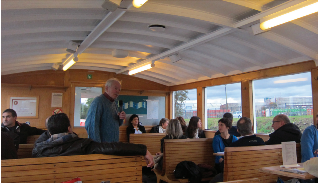
Balade sur le canal dans le cadre des formations BRISE

- Alimentation et Santé : l'alimentation est un enjeu majeur d'une société en mutation. Il s'agit à la fois de produire pour tous, mais de produire également des produits de qualité, avec une vraie valeur ajoutée, et qui puissent entrer dans une logique de diminution de la consommation énergétique et des polluants. Aujourd'hui s'inventent ou se revisitent diverses manières de consommer : circuits courts, groupement d'achats collectifs, soutien aux agriculteurs, fermes urbaines, etc. Nous avons travaillé sur le cas concret des abattoirs d'Anderlecht : ceux-ci sont encore aujourd'hui en activité et posent de nombreuses questions. Peut-on encore maintenir des activités productives en ville ? Comment gérer les normes sanitaires strictes dans des unités de petites tailles ? Est-il possible de maintenir des circuits courts en ville, avec la vente directe de viande ? Quels emplois ce genre de filière permet-elle ? L'implantation d'une ferme urbaine sur la toiture des abattoirs a été également l'occasion de s'intéresser à la thématique de l'agriculture urbaine.