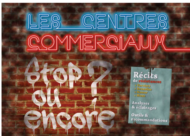
Les centres commerciaux, stop ou encore ?

Ainsi IEB se mobilise aujourd'hui contre les trois projets (NEO, Uplace et Docks Brussel), et ce, depuis 2010 au sein de la plate-forme interrégionale pour une économie durable qui rassemble la CSC-ACV, le BRAL, BBL, l'Unizo et l'UCM. En 2014, cette plateforme a ralenti ses activités, le temps pour IEB de faire le point avec la CSC et la FGTB sur les relations entre emplois et types de commerce. Les premiers résultats de cette étude ont été publiés dans le dossier du Bruxelles en mouvements n° 272 sur les centres commerciaux.