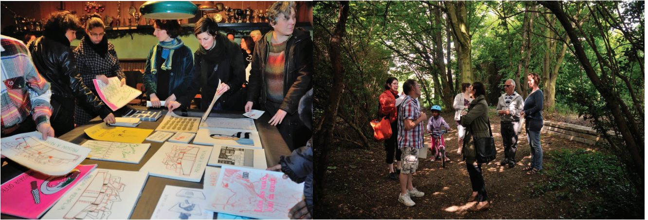
Réalisation d'affiches par les habitants de Haren sur le thème de la prison