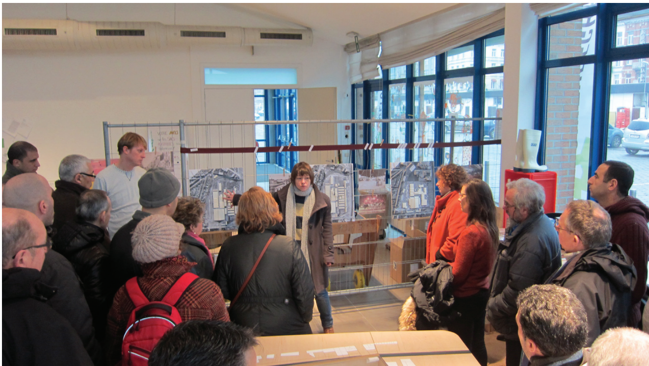
Local de Forum Abattoir

a mis sur pied fin 2013, en collaboration avec le Centre de Rénovation Urbaine (CRU) et la SA Abattoir, la structure Forum Abattoir. L'objectif de Forum Abattoir ( http://www.forum-abattoir.org ) est de faire émerger un débat sur l'avenir du site et de ses activités grâce à un dispositif permettant d'assurer la mise en débat public du devenir du site et de mener une réflexion impliquant l'ensemble de la collectivité. Celui-ci tente de penser la place et le fonctionnement des abattoirs en ville dans l'optique du maintien de la filière courte de production de viandes en milieu urbain. Les activités d'abattage présentes sur le site doivent être au centre de la réflexion pour penser la meilleure intégration de celles-ci au quartier et aux enjeux de la Région bruxelloise notamment comme levier d'une nouvelle réconciliation entre ville et industrie et de l'équilibre de l'éco-système urbain.