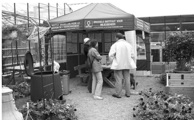
Stand d'information de l'IBGE: un des outils pour sensibiliser le public au compostage.

En Flandre, VLACO a réalisé, pour ceux qui souhaitent s'informer sur le compostage de quartier, un document reprenant tout ce qu'il faut savoir sur sa mise en place: « Wel en we wijkcomposteren » (renseignements sur www.ovam.be ).