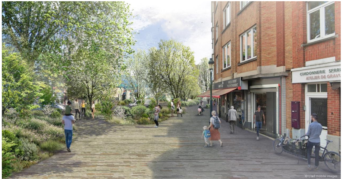
Figure : PERSPECTIVE SUR LA RUE AUGUSTE HAINAUT.

2.4.3. Terminus à la Gare du Nord : nous attirons l'attention sur l'étroitesse de l'espace au niveau de la rue des Charbonniers ainsi que sur la cohabitation avec les bus (en particulier les bus TEC et internationaux) vu qu'une bande actuellement réservée à ce mode devrait disparaître. Rappelons qu'un problème plus général de cohabitation des modes de transport a été pointé par plusieurs associations à l'occasion de l'enquête publique relative au CCN 14 .